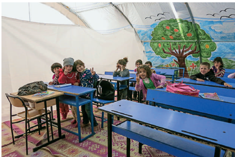
«Victory» – das Zeichen der Kämpfer – schon die Kinder kennen es, doch nicht alle schaffen es zu lächeln.