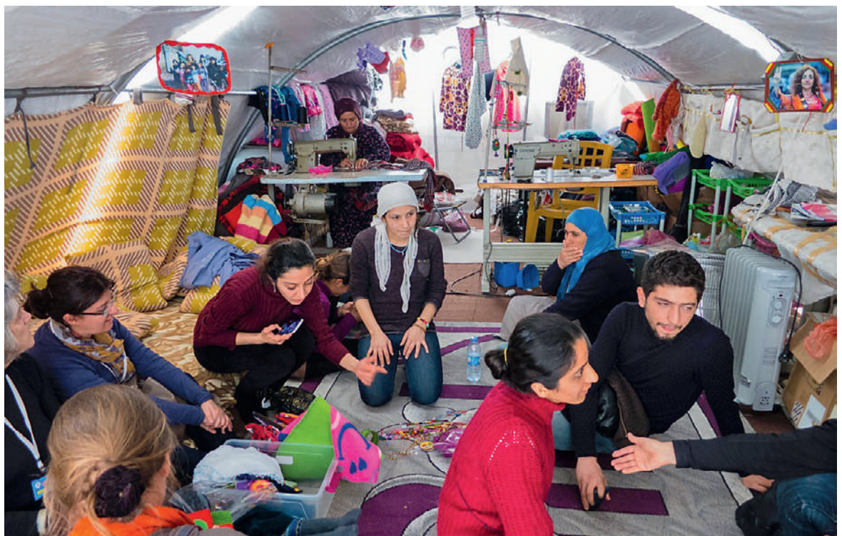
Endlich etwas Freude im Nähatelier des Flüchtlingslagers von Suruç an der türkisch-syrischen Grenze: In Kobanê wurde ein Sieg über den IS erkämpft.

Wir sind drei Ärztinnen, eine Körpertherapeutin mit Arabischkenntnissen und unsere Fahrerin. Wir reisen